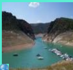
Boca del Infierno.