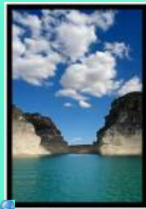
Embalse de Entrepeñas.